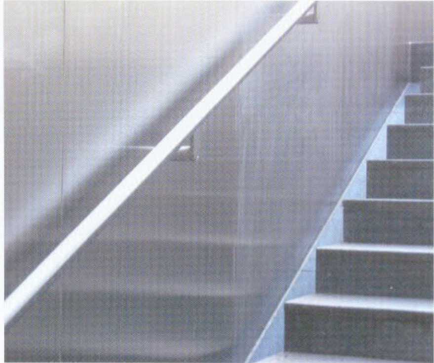
Auch das regelmäßige Reinigen von Edelstahlf lächen hinterlässt im Laufe der Zeit optische Veränderungen.