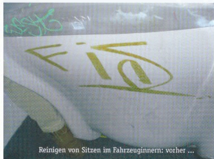
Reinigen von Sitzen im Fahrzeuginnern: vorher ...

an dieser werden regelmäßig durch entsprechendes Reinigungspersonal entfernt. Aber jede Reinigung hinterlässt optische Veränderungen. Diese summieren sich im Laufe der Zeit. Obwohl sauber, sieht das Material als solches