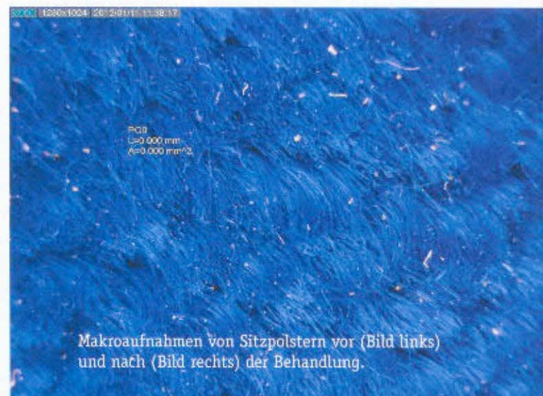
Makroaufnahmen von Sitzpolstern vor (Bild links) und nach (Bild rechts) der Behandlung.